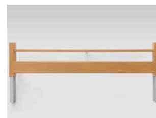
Bettverlängerung (auch nachträglich montierbar)