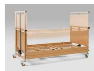
Verstellbereich von 30 bis 80 cm