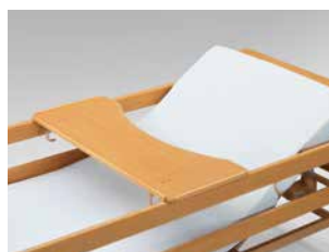
Servierblech für Allura II 100