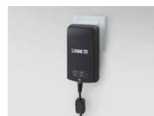
Elektronisches Schaltnetzteil (Switch Mode), direkt hinter Netzstecker integriert