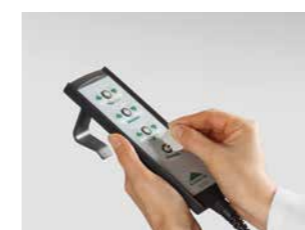
Handschalter mit selektiver Sperrfunktion