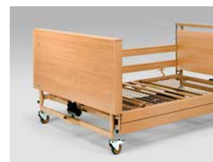
Holzfällung zur Verkleidung des Fahrgestells (auch nachträglich montierbar)