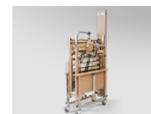
Platzsparende Auslieferung und Lagerung auf Lager-/Transporthilfe (Abb. ähnlich)