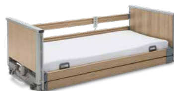
▲ Durchgehende Seitensicherung (DSG)