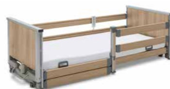
▲ Geteilte kombinierbare Seitensicherung (KSE)