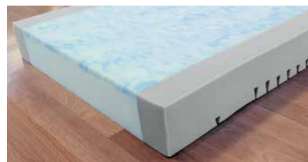
▲ Modell Sky-fit mit hochwertiger Skytherm®-Auflage.

Verbringen Bewohner viel Zeit im Bett, bieten Original-Burmeier-Matratze eine ideale Kombination aus Komfort und Prävention. Sie sind genau auf die Aufteilung der Liegefläche abgestimmt und machen jede Bewegung mit. Bei Verstellung der Rücken- und Oberschenkellehnen sorgen sie so für ideale Druckentlastung. Die Modelle Sky-fit und Comfort-fit sind zudem Wendematratzen mit einer glatten und einer eingeschnittenen Seite. Dadurch sind diese Matratzen niemals „zu hart“ oder „zu weich“ – sie lassen sich einfach umdrehen und bieten zwei verschiedene Liegegefühle.