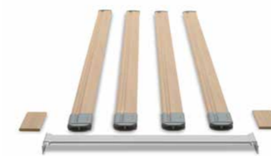
▲ Mit dem Verlängerungs-Set lässt sich die integrierte Bettverlängerung optimal nutzen.

Mit Original-Zubehör von Burmeier wird das Lenus zu einem Bett, das keinen Wunsch offenlässt. Bereits integriert ist eine ausziehbare Verlängerung des Bettrahmens um 20 cm. Zu ihrer Nutzung steht ein Verlängerungs-Set mit einem Ergänzungsstück für die Liegefläche, längeren Seitensicherungsholmen und Füllstücken für die Seitenblenden zur Auswahl. Auch ein passendes Polsterteil zur Verlängerung der Matratze ist erhältlich. Leselampe und Unterbettlicht sorgen für angenehmes Licht und sichere Orientierung bei Nacht. Unruhige Bewohner schützt der Schaumlederbezug vor Stößen gegen die Seitensicherung. Ein praktisches Serviertablett für Mahlzeiten wird einfach auf die Seitensicherung gelegt.