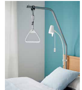
▲ Leselampen lassen sich in die Aufnahmehülse stecken oder am Aufrichter befestigen.