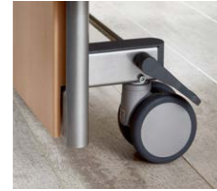
Paarweise Rollenfeststellung • in jeder Liegeflächenposition