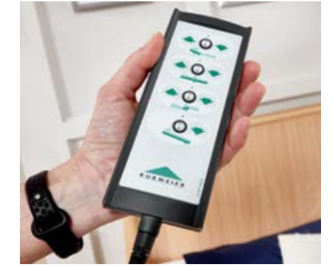
Handschalter • mit selektiver Sperrung