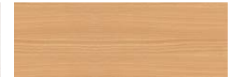
Buche Natur (Standard)