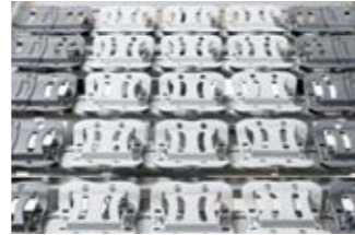
9 10 Die Komfortliegefläche besteht aus 50 freischwingenden Federelementen.