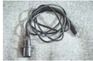
8 Verlängerungskabel für den Handschalter (1,40 m).