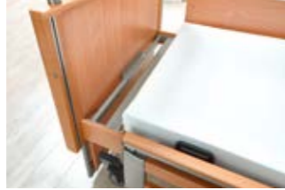
2 3 Bettverlängerung.