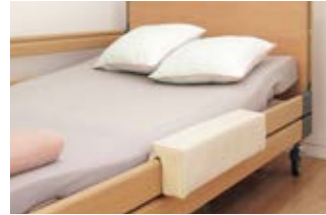
6 Das Füllpolster lässt sich auf die durchgehende Seitensicherung stecken und erleichtert das Sitzen auf der Bettseite.