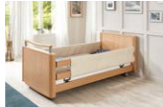
14 Schaumlederbezug für DSG.