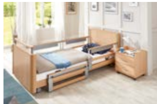
17 18 Teleskopierbare Seitensicherung (TSG).