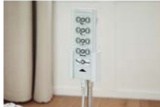
7 Flexibler Geberhalter für den Handschalter.