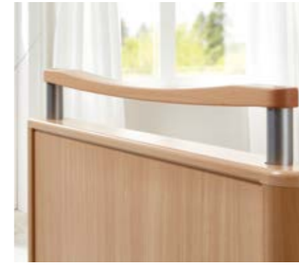
Griffleiste • aus Massivholz