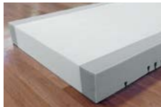
21 Pflegebettmatratze Comfort-fit.