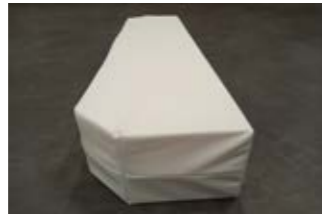
13 Polsterteil für Bettverlängerung.