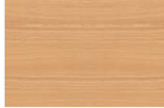
4 Dekor Buche Natur.