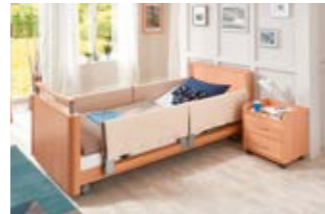
15 Schaumlederbezug für TSG.