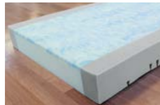
20 Pflegebettmatratze Sky-fit.