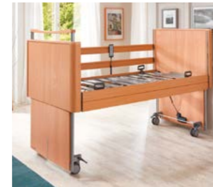
Liegehöhenverstellung • von 22-77 cm • Verstellbereich = 55 cm