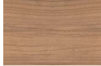
5 Dekor Kirsche Havanna.