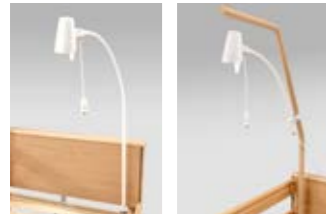
11 12 Leselampe Sola.