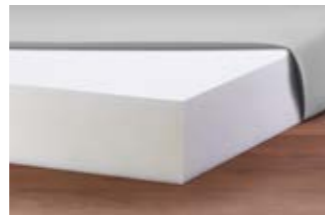
22 Pflegebettmatratze Basic-fit.